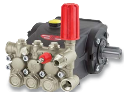
E 3 - VH version