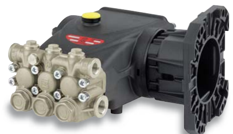
E 3 - C 1" version