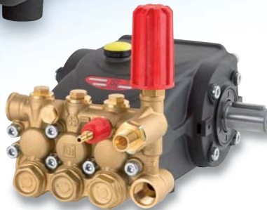
E 3 - VH version

After the E2 Series Interpump Group, the world's largest manufacturer of high pressure plunger pumps, is proud to announce the launch of another technological jewel: E3 "Evolution 3" Series, which it considerably extends the range of the new generation pumps.