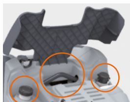
Casing with liftable cover Корпус с подъемной крышкой