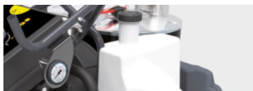
Ванночка для воды и цистерна для защиты от известковых отложений