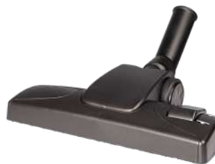
Комбинированная насадка 280 мм Арт. 114,114