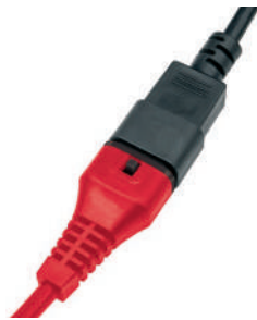
Встроенная защита кабеля.