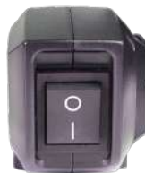
Удобная кнопка включения.