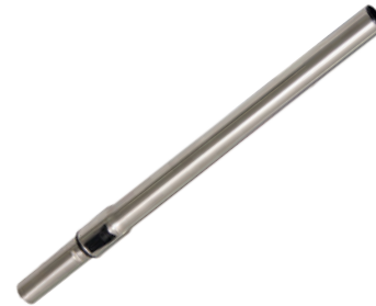
Трубка телескопическая нержавеющая 0,6–1,0м.