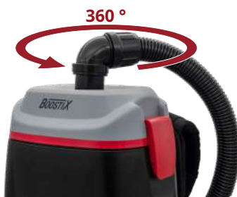
Поворотное соединение на 360°, безграничная маневренность.