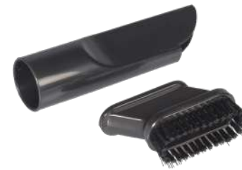
2in1 щелевая / обивочная насадка.