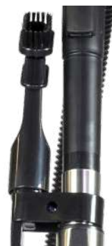
Удобное хранение аксессуаров.