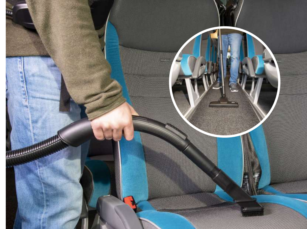
Предмет номер. Соединенное производство