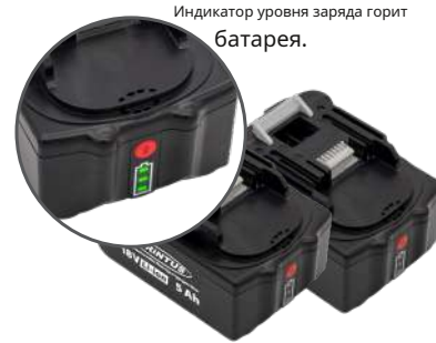
Индикатор уровня заряда горит батарея.