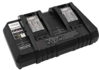
Предмет номер. 119,121