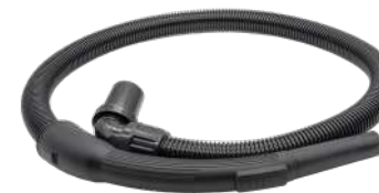
Всасывающий шланг 1,3 м. Предмет номер. 119,124