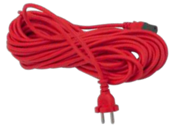
Шнур питания, 15 м с возможностью подключения.