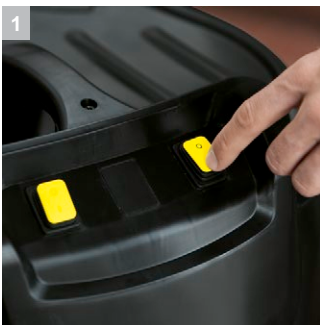
1 2 мотора

Впечатляющий своей мощностью двухтурбинный профессиональный пылесос влажной и сухой уборки NT 70/2 Adv из линейки профессиональных пылесосов влажной и сухой уборки Kärcher NT 70 которая состоит из больших и мощных пылесосов с различным количеством моторов, до 3 штук. Данная линейка моделей особенно незаметна и впечатляет своими возможностями когда речь идет о влажной уборке и возможности собирать крупный мусор. Высокая мощность всасывания и проверенное на деле качество от Kärcher. Версия Adv - предоставляет клиенту расширенную ком-